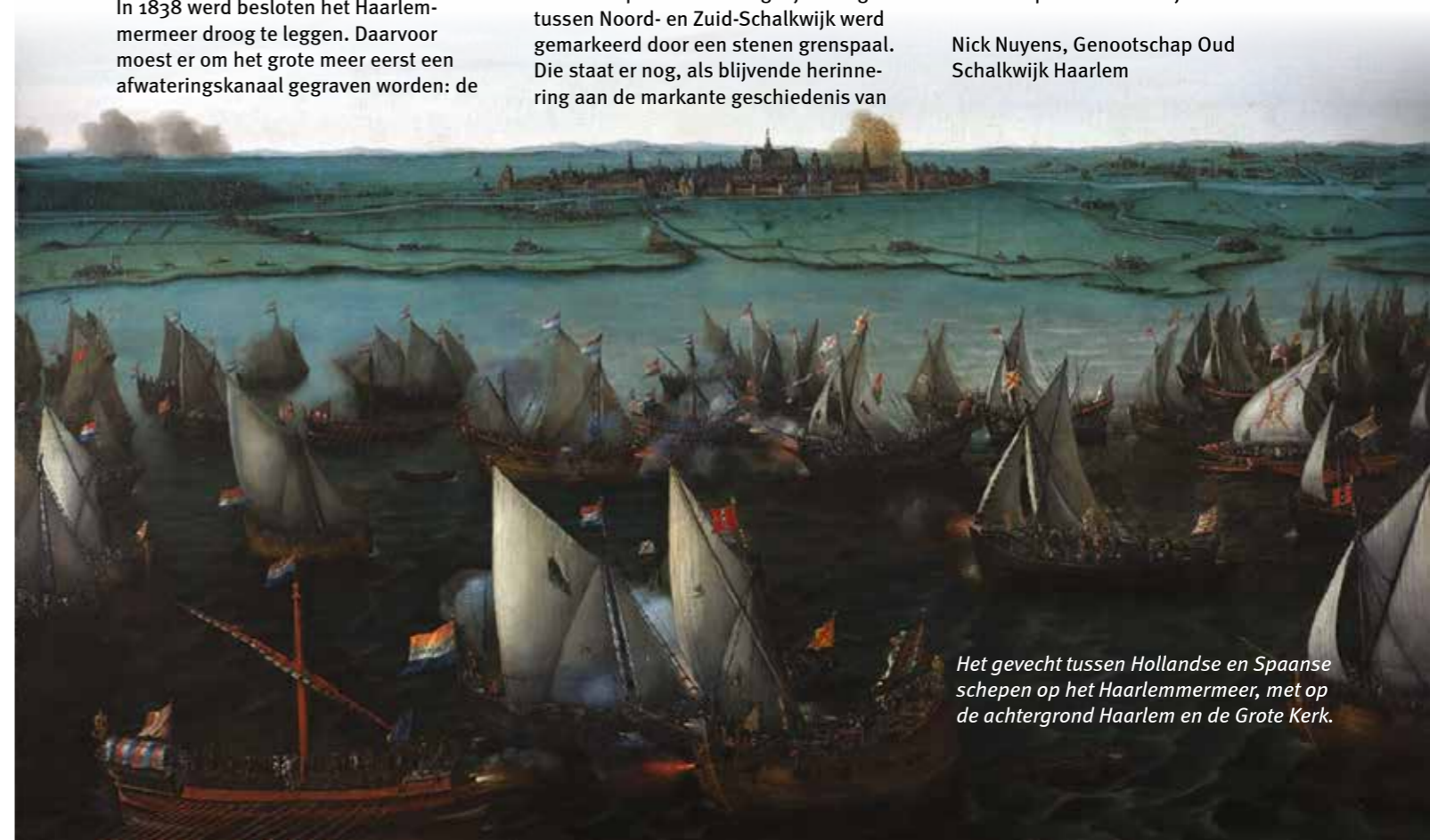
Het gevecht tussen Hollandse en Spaanse schepen op het Haarlemmermeer, met op de achtergrond Haarlem en de Grote Kerk.

Nick Nuyens, Genootschap Oud Schalkwijk Haarlem