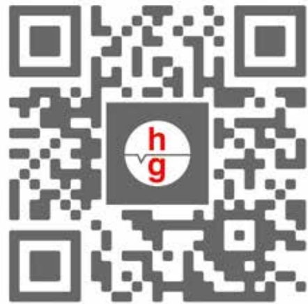
QR-code van de 'Van Gelder Werkt' app.

Waarom werkt de gemeente ook alweer aan onze wijk? Ten eerste natuurlijk om de verouderde straten en groenstroken aan te pakken, die hebben groot onderhoud nodig. Daarnaast hebben we te maken met meer heftige regenbuien en drogere en warmere zomers. Daar moet ook Meerwijk op aangepast worden. Dat gebeurt bijvoorbeeld door meer bomen te planten; hun schaduw houdt straten koeler. De woonstraten, waar pas vanaf volgend jaar aan wordt gewerkt, worden eenrichtingsverkeer met meer speel- en ontmoetingsplekken. Onder de grond komt een nieuw riool, nieuwe elektriciteit en nieuwe waterleidingen die passen bij een groeiende wijk.