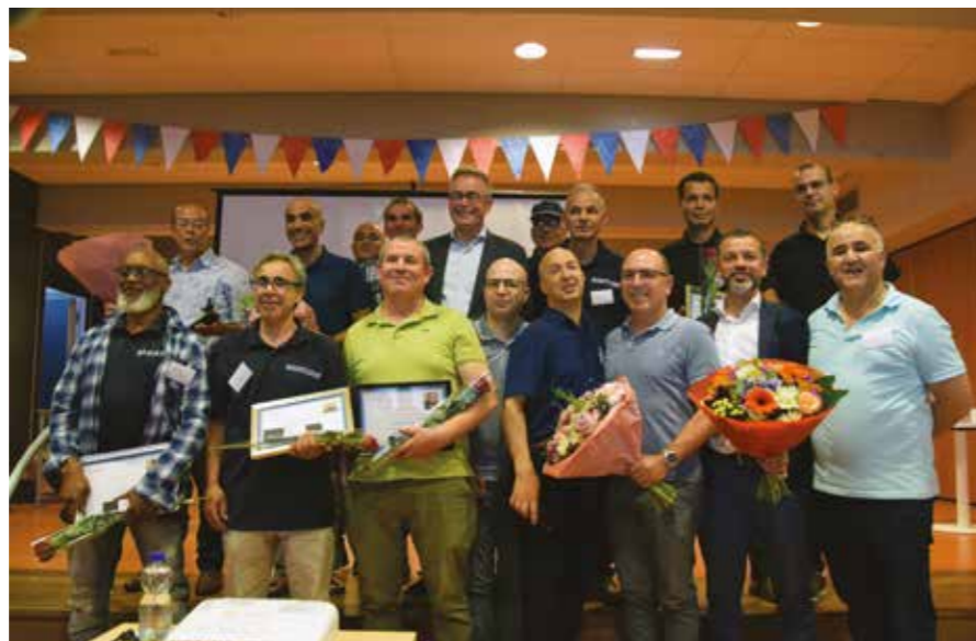
Vrijwilligers, met in hun midden de burgemeester.

Stichting De Brug is een actieve Marokkaanse zelforganisatie die een bijdrage wil leveren aan het bevorderen van de emancipatie, integratie en participatie van de Marokkaanse gemeenschap. Sinds de oprichting in 1997 heeft De Brug hard gewerkt aan het aanpakken van achterstandssituaties in de Haarlemse gemeenschap. Een van de meest bekende en succesvolle projecten zijn de Buurtouders. In 2004 nam De Brug het initiatief om de krachten te bundelen van alle Haarlemse Marokkaanse organisaties, in de Stichting Samenwerkende Marokkaanse Organisaties in Haarlem (SMOH). Daarnaast heeft De Brug activiteiten opgezet gericht op voorlichting, educatie, cultuur, sport en welzijn.