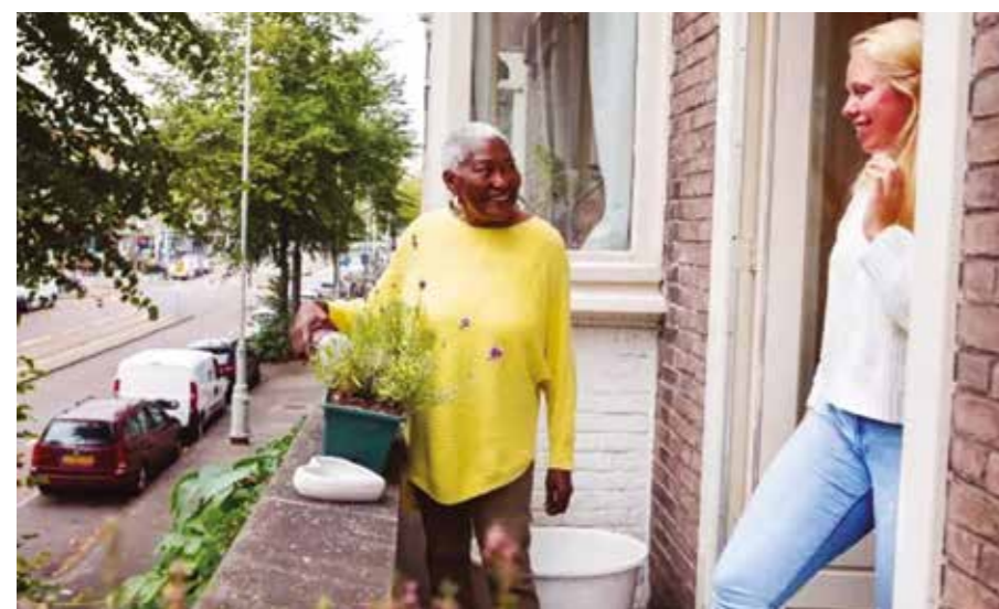
'Nu mijn zonen het huis uit zijn, heb ik ruimte over.'

Aanmeldingen van huurders worden gescreend. De huurder zoekt tijdens de huurperiode naar een structurele woonruimte en heeft de verwachting binnen een jaar zijn leven weer redelijk op orde te hebben. Heeft u interesse? Kijk voor meer informatie op www.onderdepannen.nl . Iedereen met een kamer over kan zich aanmelden!